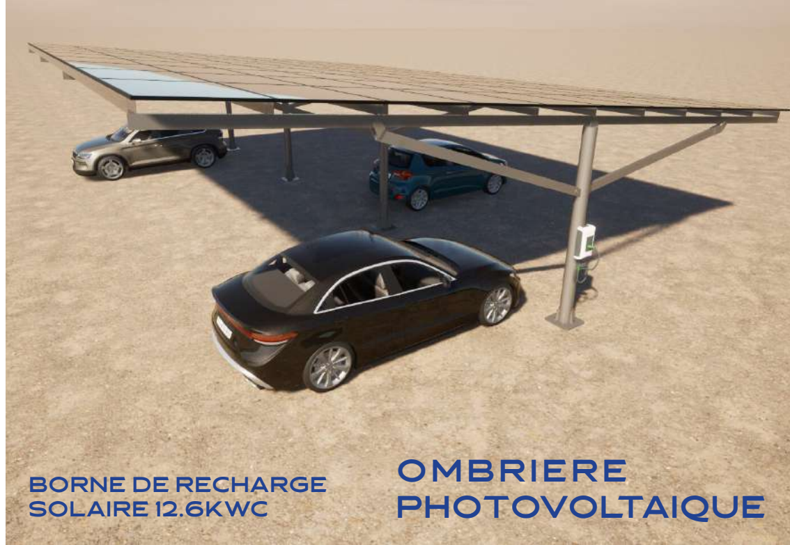
BORNE DE RECHARGE SOLAIRE 12.6KWC